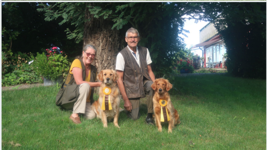
Lördag 27 augusti var vi på Kennelklubbens stora utställning i Backamo med Kraftfulla Gloria och hennes dotter Målriktade Madicken. Gloria fick omdömet Very Good medan Madicken (Maddie) fick Excellent. Nedan ser Du överst Gloria och därunder Maddie.